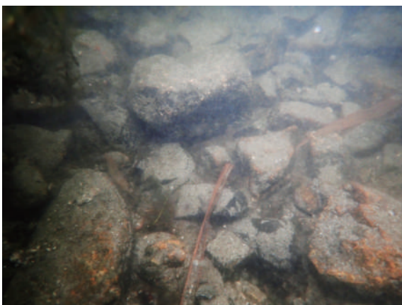
図2 湖底の南1区礫群（径5～25cm）