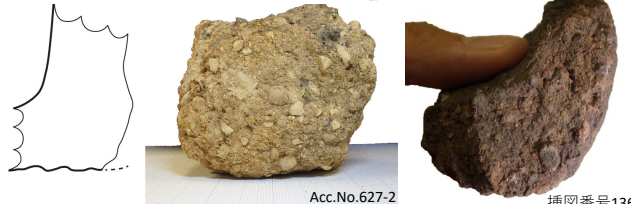
グアム島北部の土器底部1(1500±90BP) 石野遺跡の土器底部 東京都教育庁所蔵